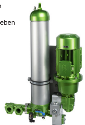
FG Filtermodul Pi 83116